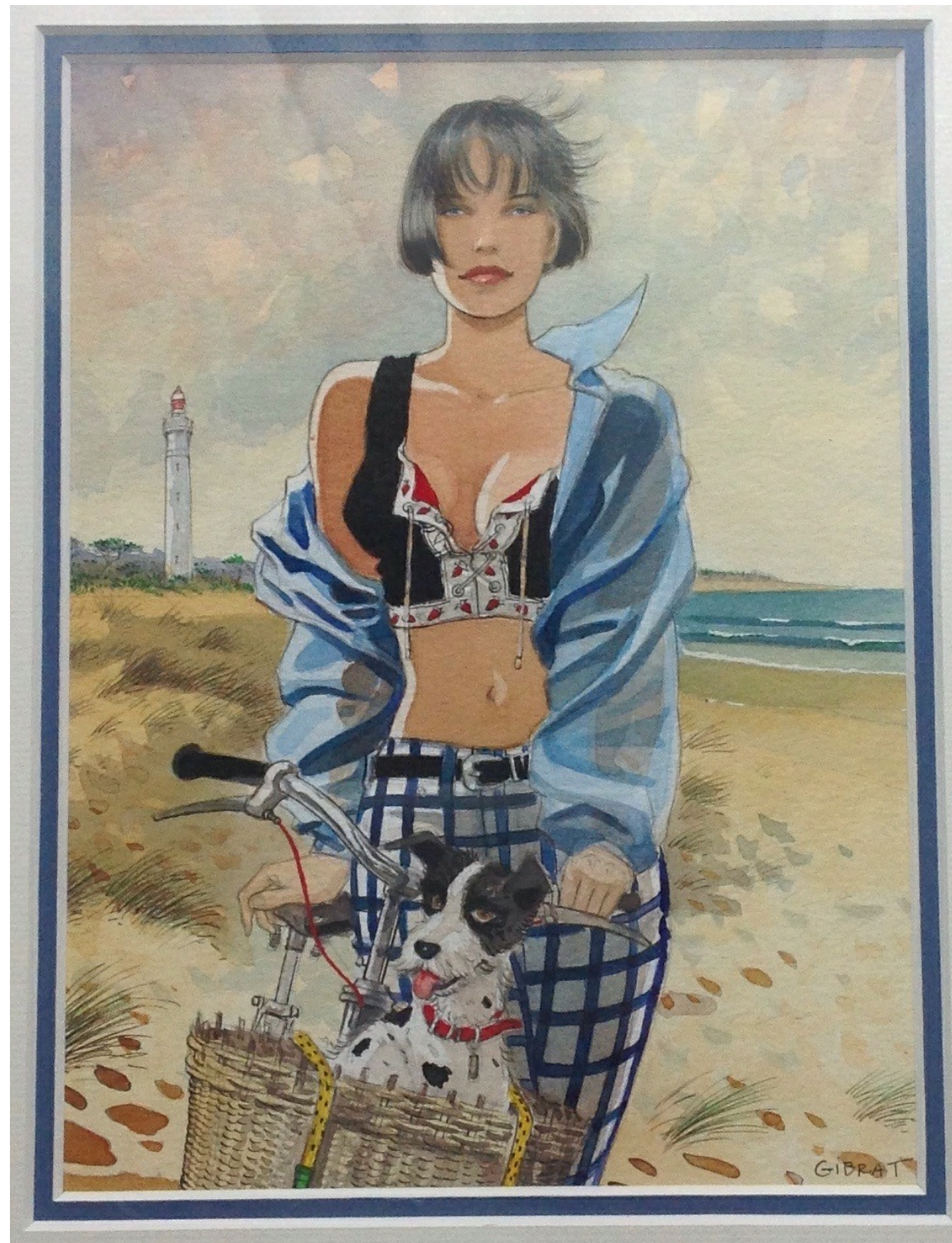
Cette illustration est dans la collection de Lucky3988

Ou alors, soyons fous, cette superbe planche de Murena :