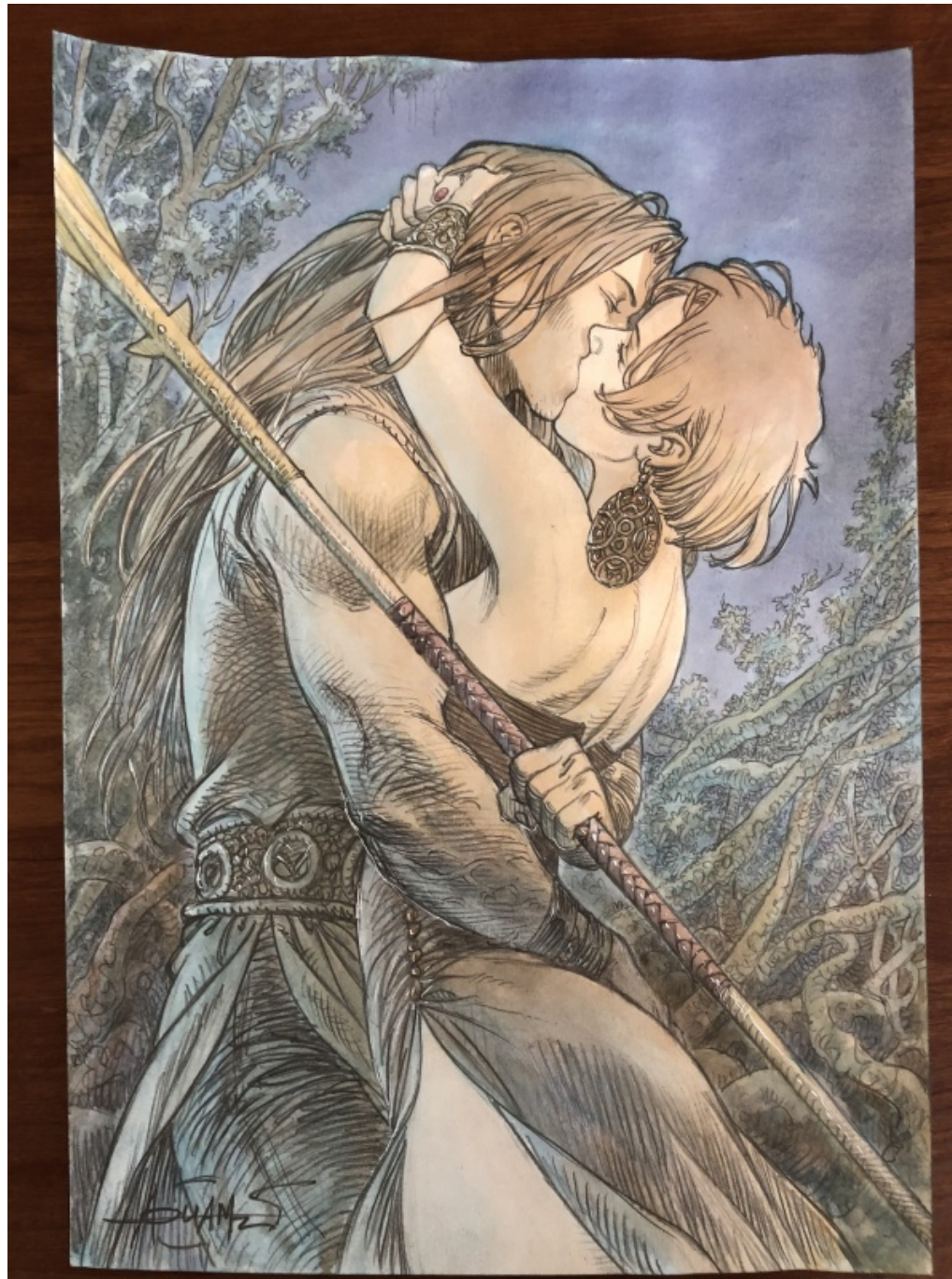
Cette illustration est proposée à la vente par Ambreville

Oui, oui, il arrive parfois que je m'intéresse à d'autres auteurs que mon trio favori !