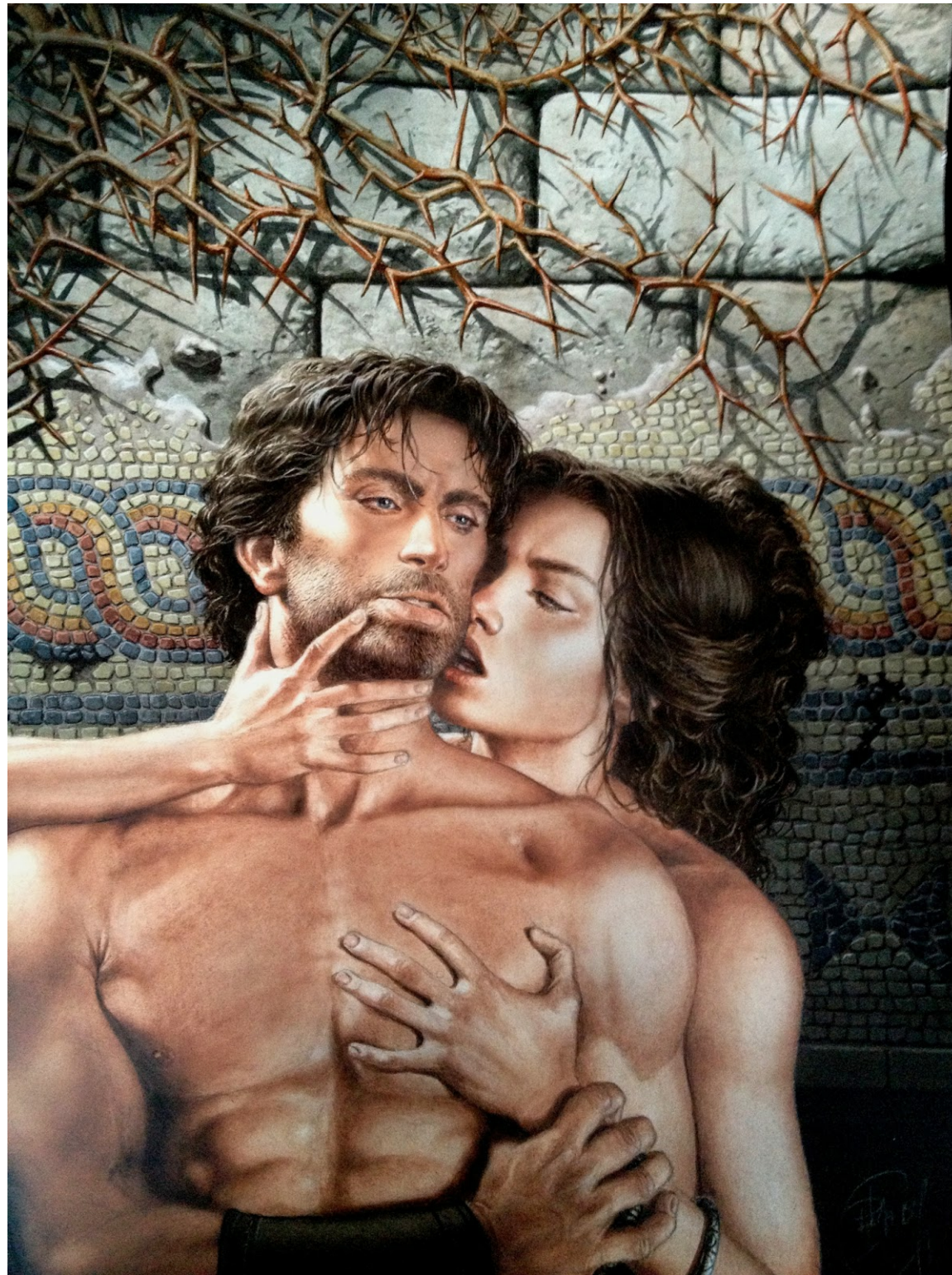
Murena T9 "Les épines" par Philippe Delaby

Ceci dit, je n'ai pas à me plaindre car je me suis bien rattrapé depuis... J'aime vraiment beaucoup les différentes œuvres que j'ai réussi à rassembler dans ma collection et, à mon humble avis, elle va encore certainement évoluer !