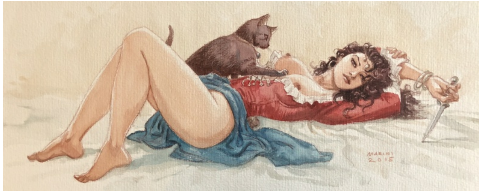
Cette illustration est proposée à la vente par Ice

Je pense que je me laisserais volontiers tenté par la jolie Mejaï et son chat dans la collection de Ice (qui est d'ailleurs devenu un ami entretemps) :