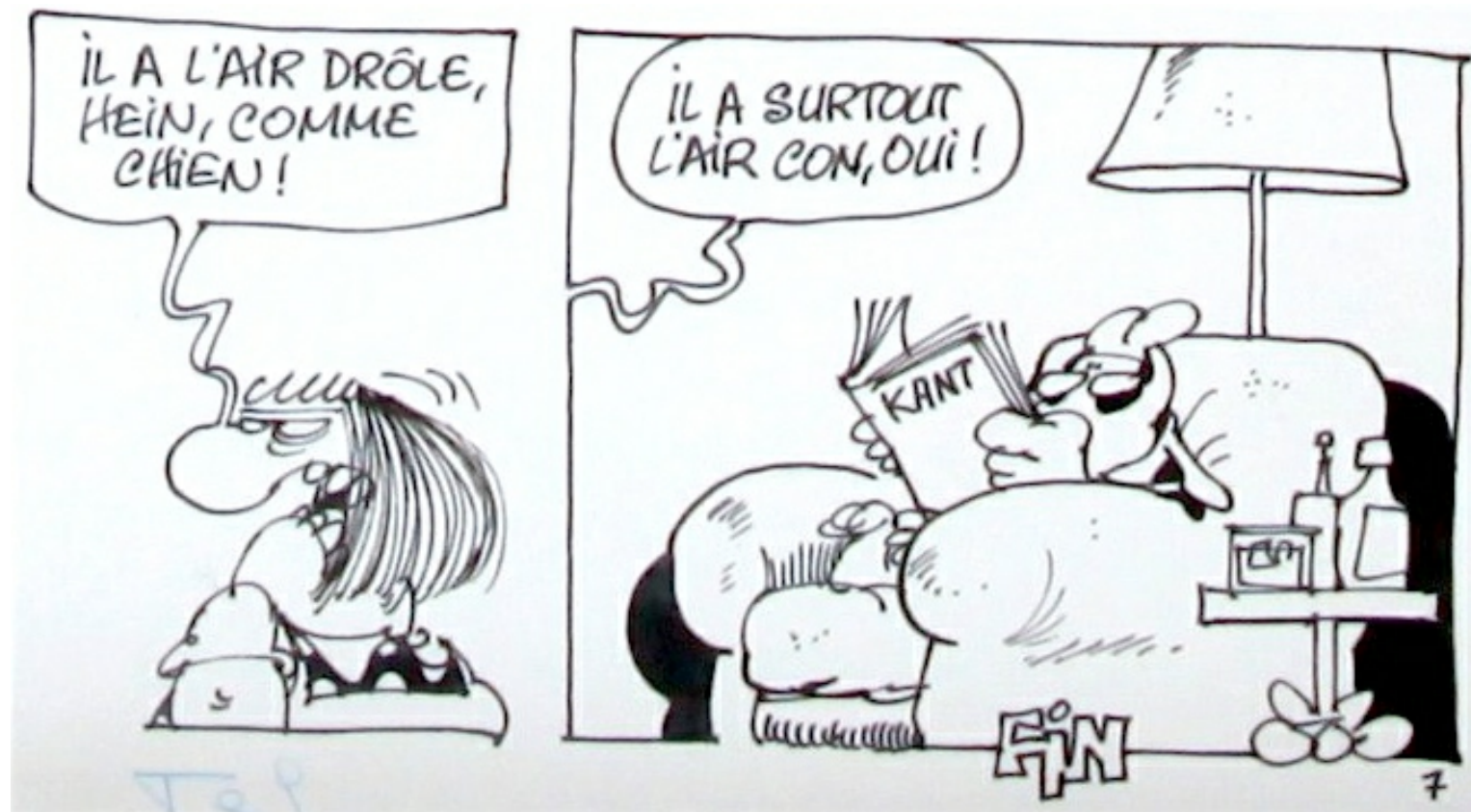
Extrait d'une planche présentée dans la collection de Zenitram