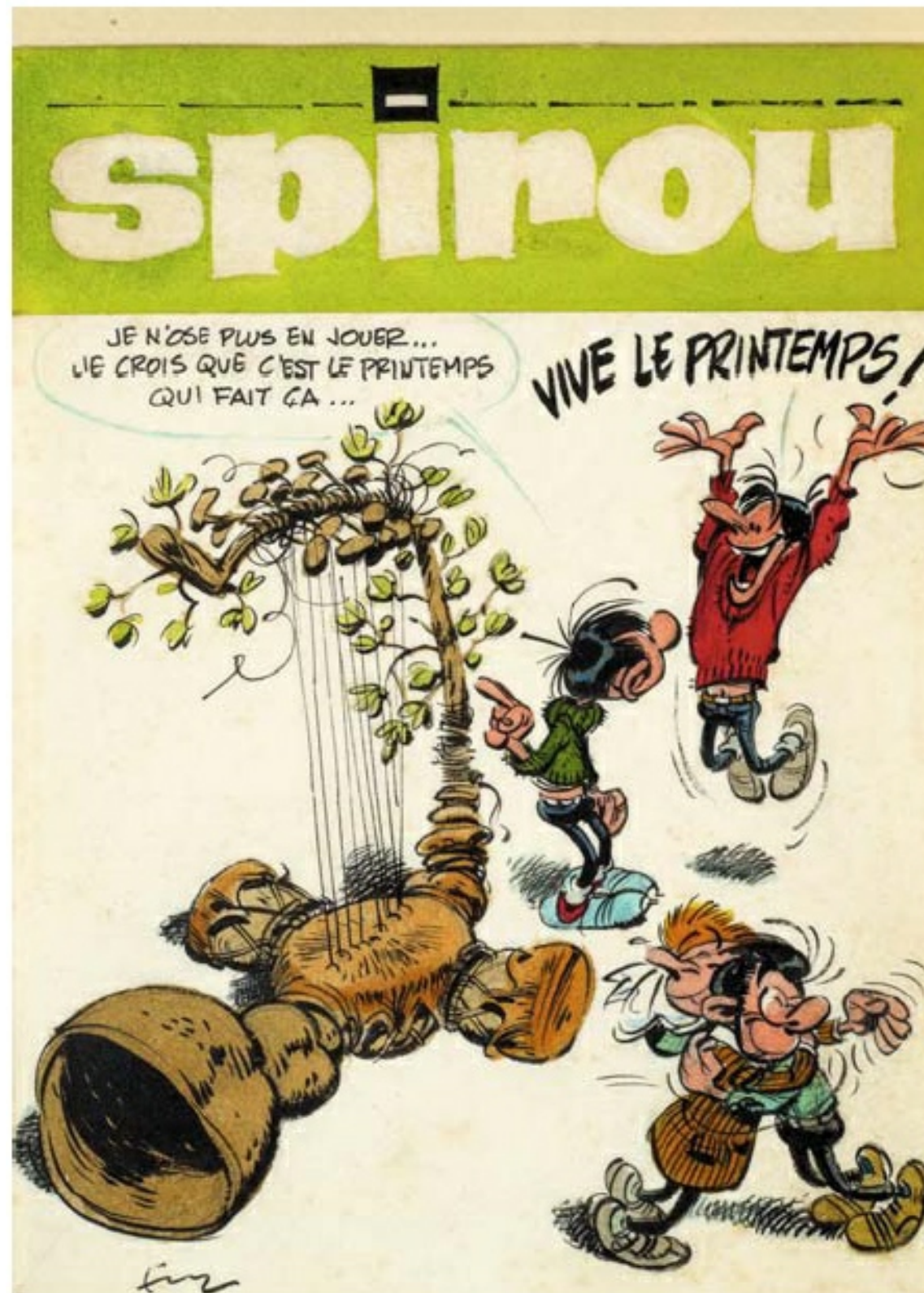
Cette illustration est dans la collection de Potdenutella

Ce projet de couverture m'a rappelé la merveilleuse exposition Franquin à Autoworld (Bruxelles) où plusieurs couvertures étaient présentes. Ce trait vif et ce sens du mouvement au service d'une vision humaniste respirent le Franquin. Au Gaston étonné par un superbe Gaffophone