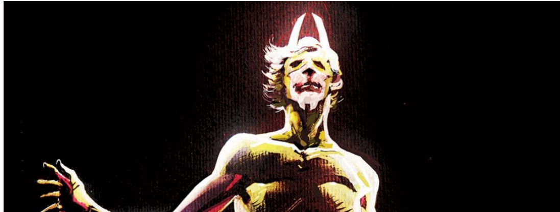
Photonik par Ciro Tota

Ce serait Photonik , un super héros made in France, mis en lumière par Ciro Tota, sur le modèle de Blek le Rock avec 3 personnages liés par la vie: la jeunesse / l'âge adulte / la vieillesse.