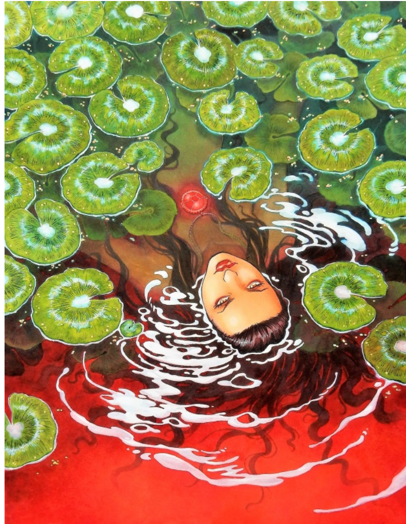
Couverture de Layla par Mika dans la collection de Lucky3988