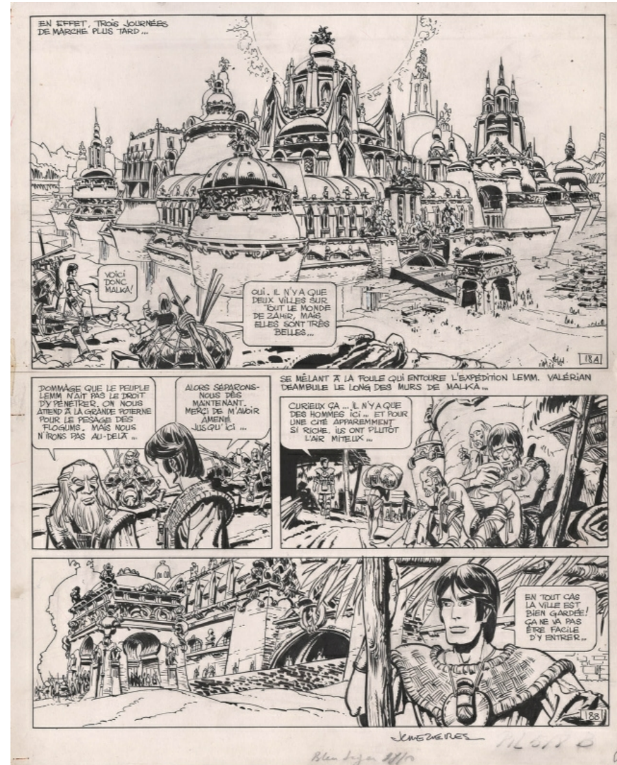
Valérien, Le Pays sans étoile par J-C Mézières

Question difficile peut-être la planche du Pays sans étoile de Mézières, que j'avais achetée à la Galerie du 9ème art, avec sa sublime première case :