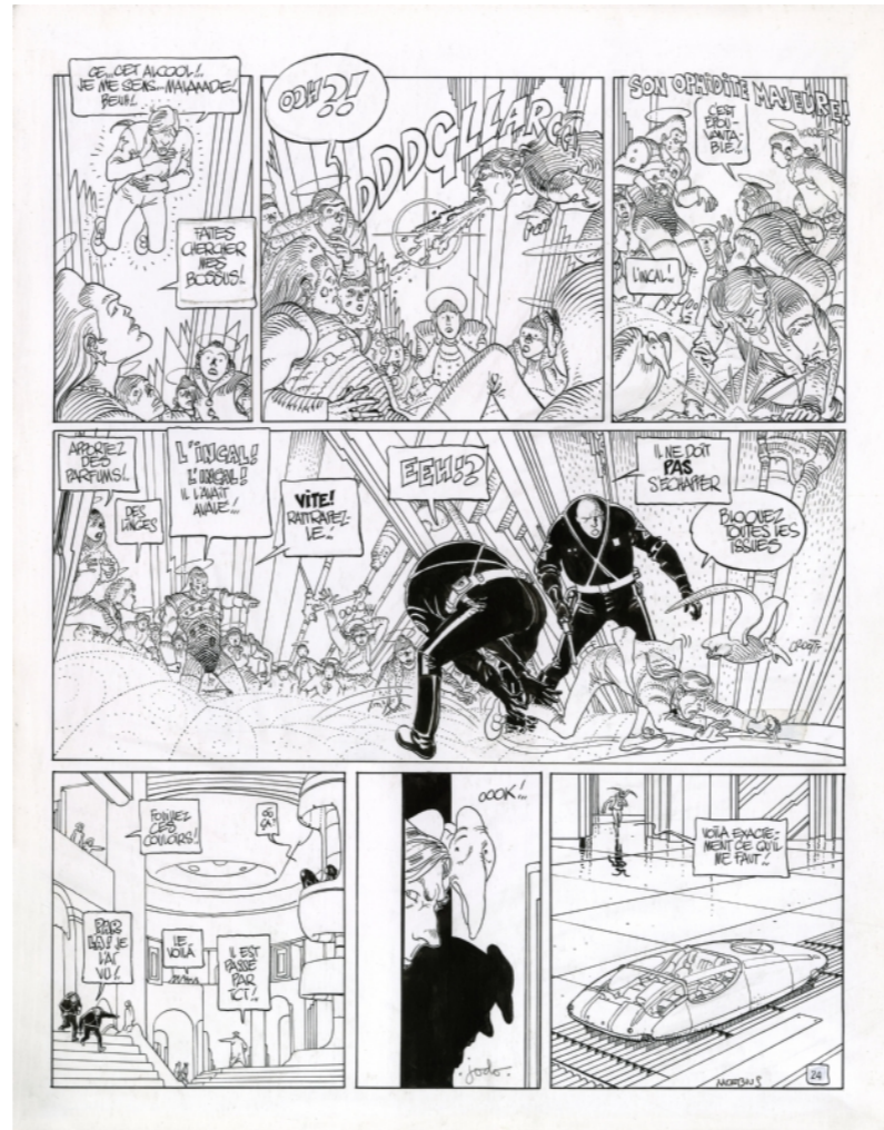
Planche de L'Incal par Moebius

Une planche de L'Incal de Moebius que j'avais hésité à acheter à l'époque chez Huberty & Breyne pour 1000 euros :