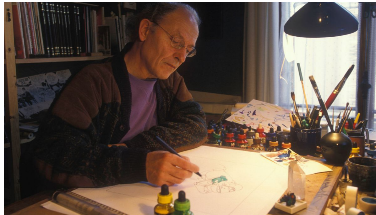
Jean Giraud / Gir / Moebius à sa table à dessin