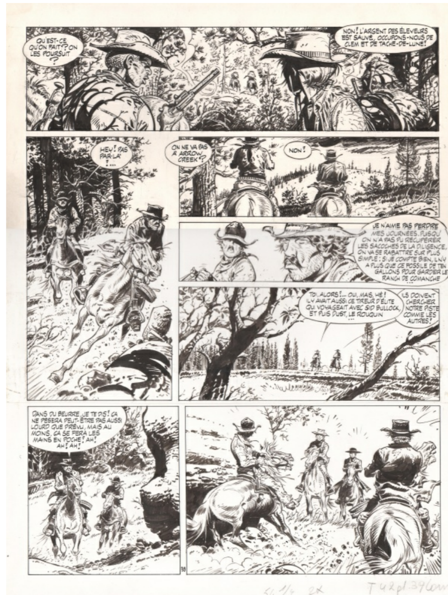
Les Loups du Wyoming par Hermann

Pour l'anecdote Hermann m'avait averti qu'il ne vendait qu'une seule planche par personne, à titre exceptionnel. Il m'avait demandé de choisir celle que je voulais parmi ses albums .