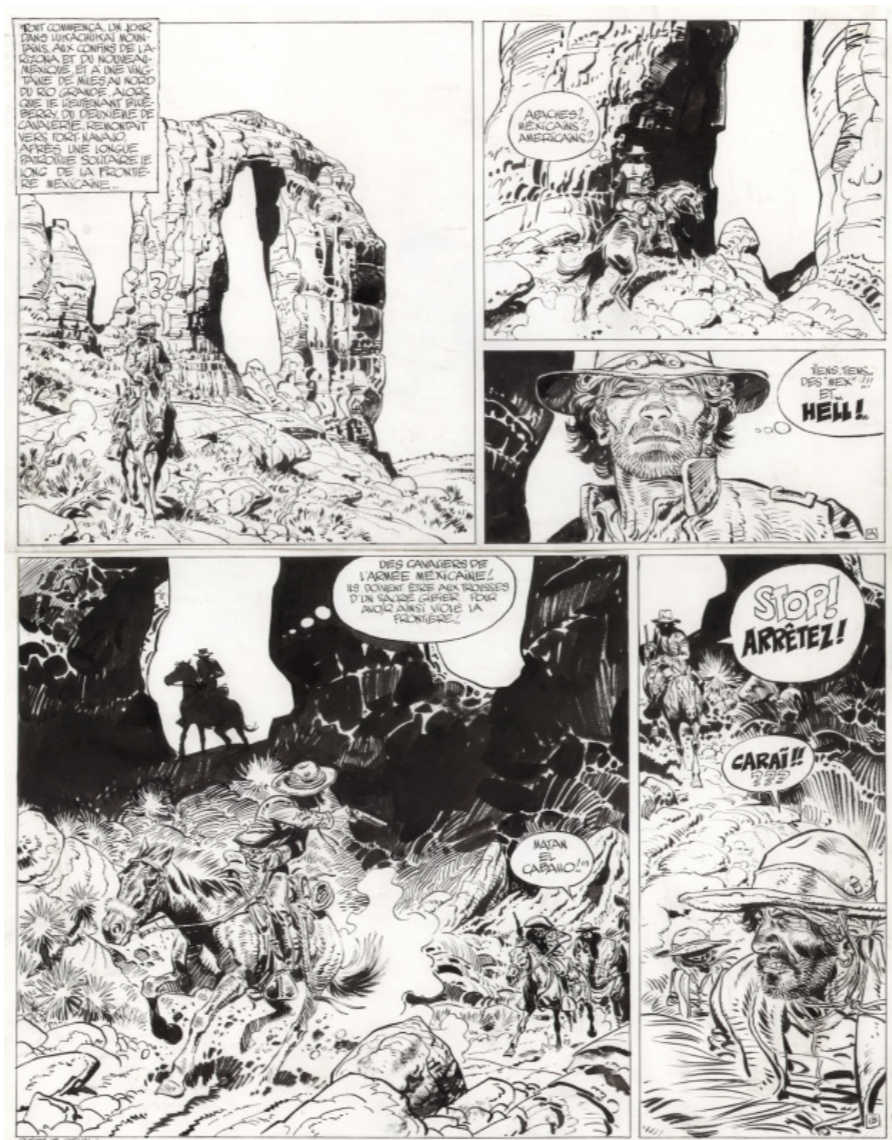
Chihuahua Pearl planche 1 par Gir dans la collection de Jfmal

Sans hésiter la planche 1 de Chihuahua Pearl dans la collection de Jfmal :