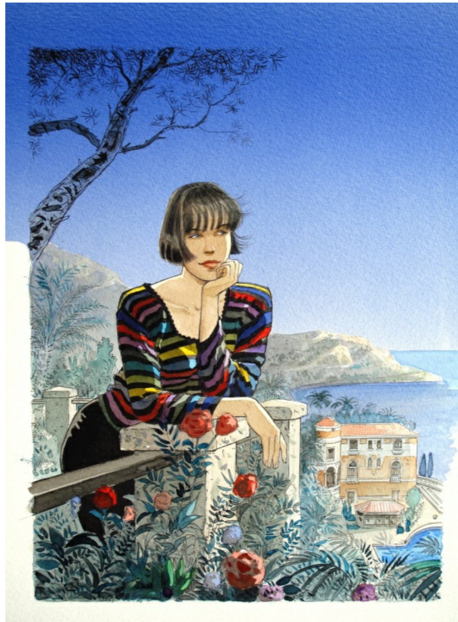
Illustration de Jean-Pierre Gibrat parue dans la Revue " Elle"