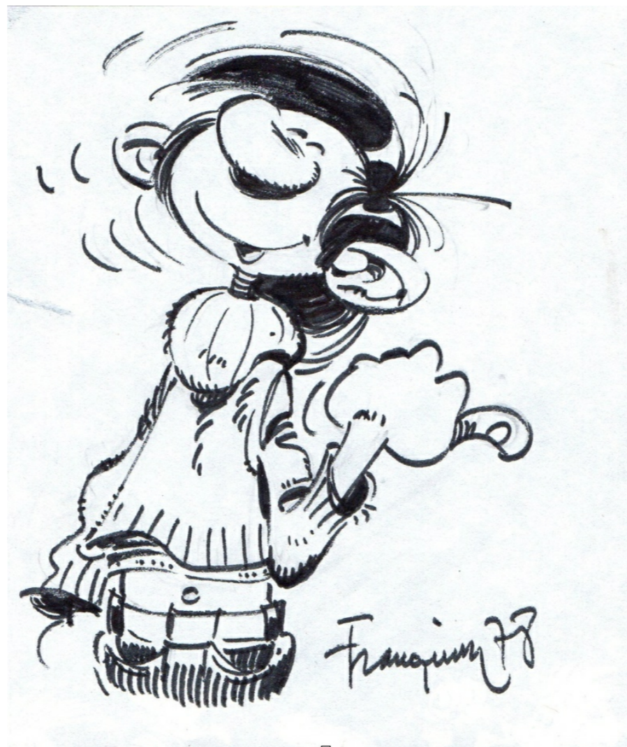
Dédicace de Gaston Lagaffe par André Franquin

Je me rappelle avoir hésité très longtemps avant de prendre mon courage à 2 mains et de l'aborder (ce qui m'étonne d'ailleurs toujours aujourd'hui). Il n'a pas été fâché du tout et avec toute sa gentillesse habituelle il m'a réalisé, au Bic et au feutre, ce splendide dessin de Gaston :