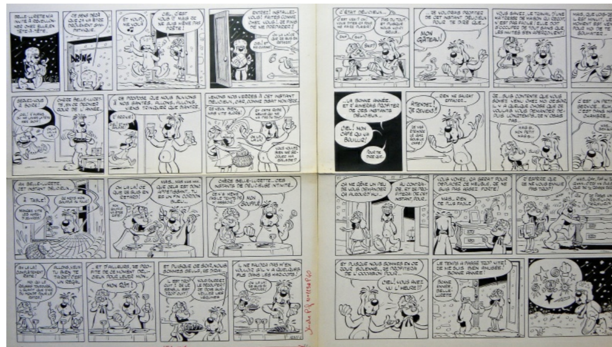
Cette oeuvre est proposée à la vente par la galerie Zic & Bul