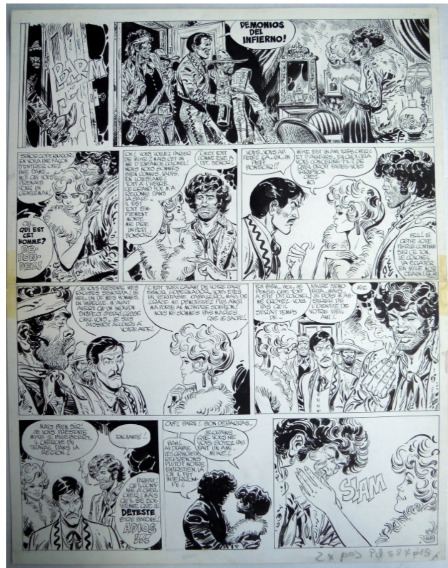
Chihuahua Pearl par Gir dans la collection de MisterA