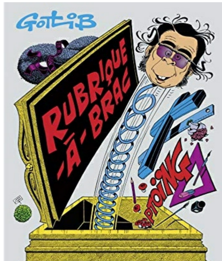
Couverture de Rubrique-à-Brac Tome 5 par Gotlib

En rentrant de mes cours et devant patienter avant de rentrer au kot, j'avais acheté dans une librairie le premier « Rubrique à Brac » de Marcel Gotlib. Dès la première planche du « Pélican » ce fut la révélation : Rhâaa lovely !!