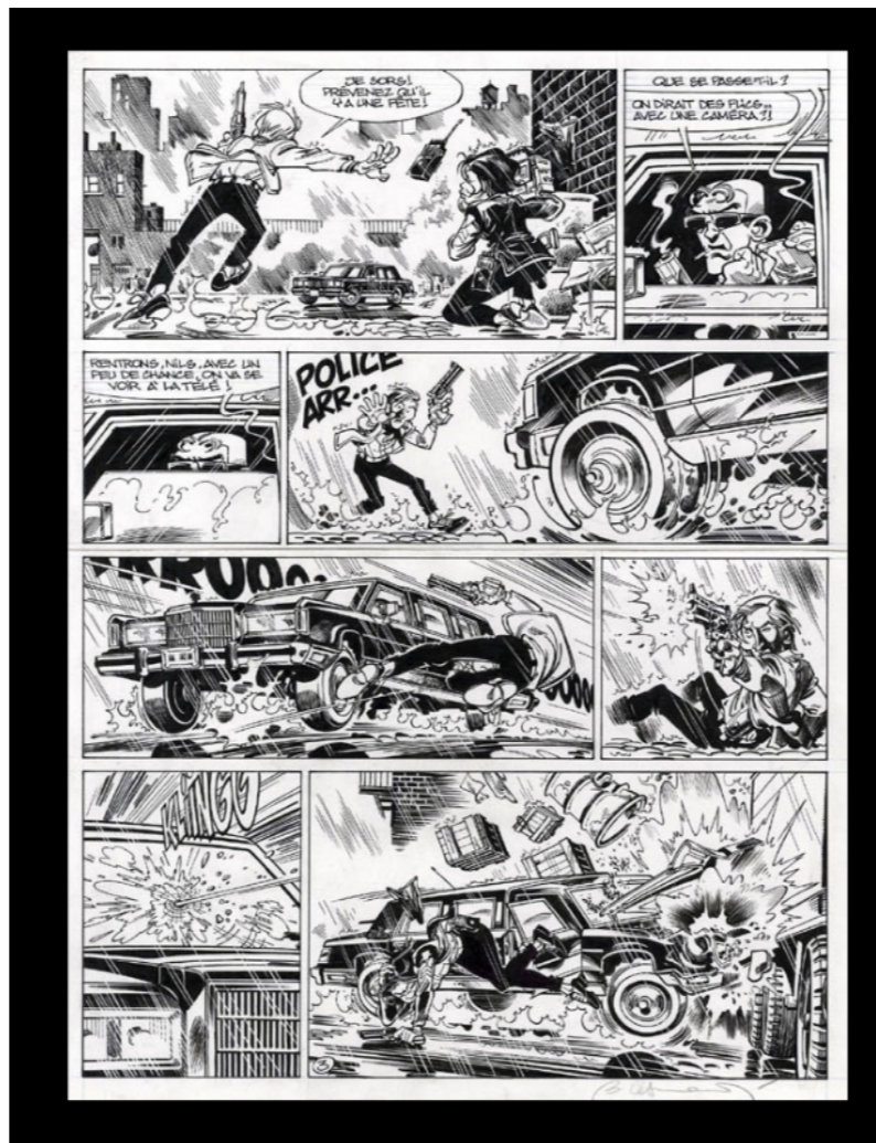
Planche de Soda dans la collection de Arpagon