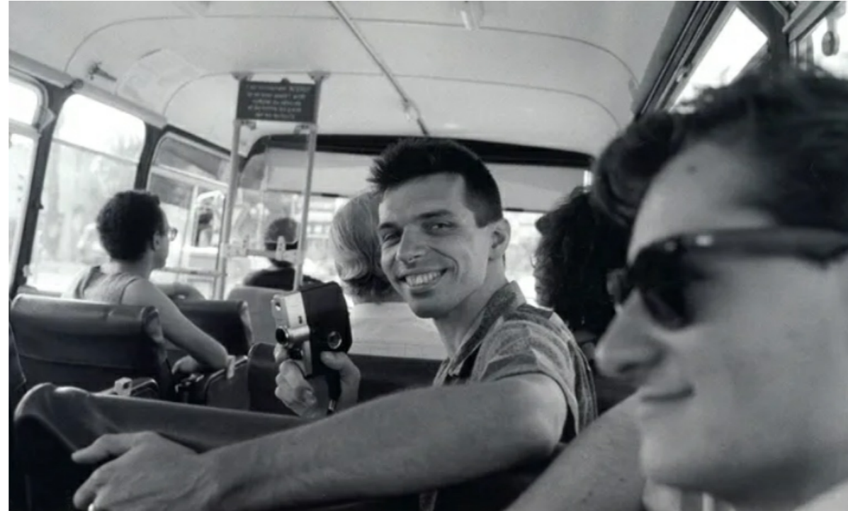
Yves Chaland en 1986.

pas réussi à me faire une idée de qui il était vraiment. D'ailleurs j'ai un peu l'impression que c'était aussi le cas pour son entourage et c'est la raison pour laquelle j'aurais aimé le rencontrer.