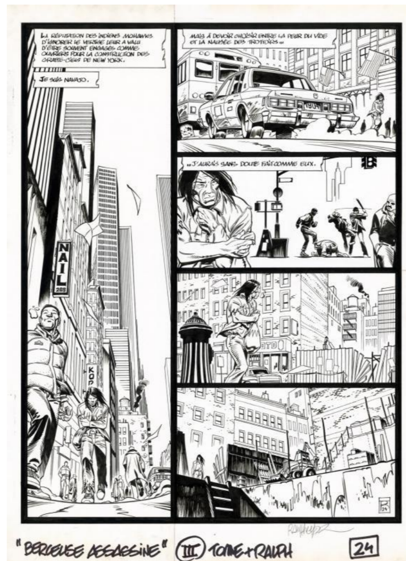
Planche originale de Berceuse Assassine par Ralph Meyer

J'étais à peine adulte et elle m'a marquée. Tant la BD que cette planche en particulier. Je me souviens encore de l'effet qu'elle m'avait fait en la lisant assis en tailleur sur mon lit. La solitude de l'indien, l'énorme case verticale, la référence ultra explicite à Taxi Driver, ce n'était clairement plus l'ambiance des Tuniques Bleues , de Gaston ou de Gotlib. La BD allait au-delà de me faire rire, me divertir ou me faire voyager, elle pouvait vraiment m'emmener sur le terrain du cinéma avec un pouvoir d'évocation différent.