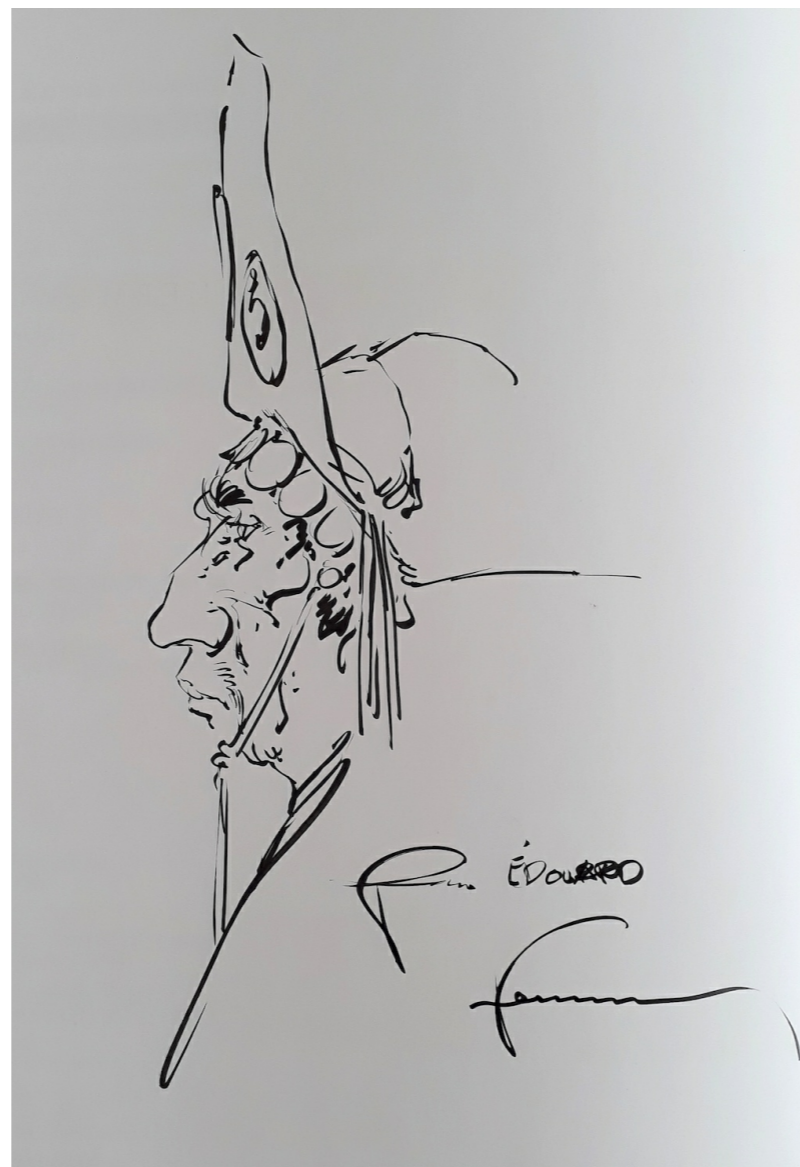
Dédicace par Hermann

pâté en l'écrivant, ne sachant plus comment il s'écrivait.