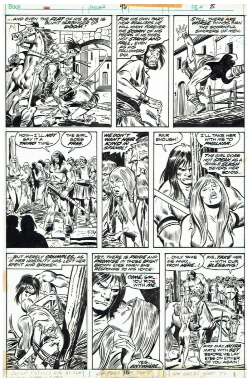
Planche de Conan par Buscema / Sinnott proposée à la vente par Comic Art Factory

Pourtant le mélange marche bien sur cette planche et en fait une sorte de jolie curiosité :