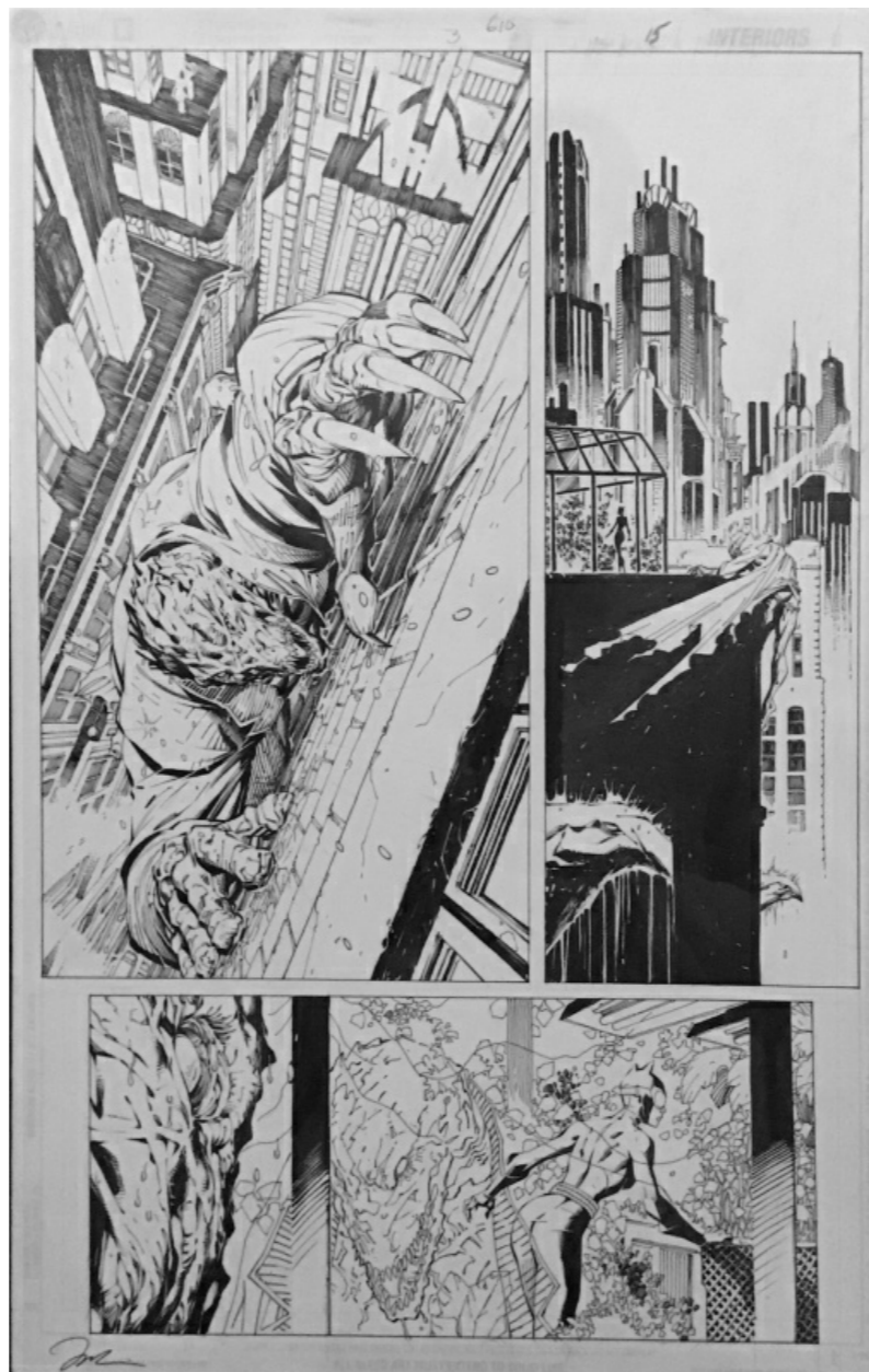
Batman Hush par Jim Lee proposée à la vente par Batfab

La Batman Hush par Jim Lee de Batfab pour ses perspectives complètement dingues :