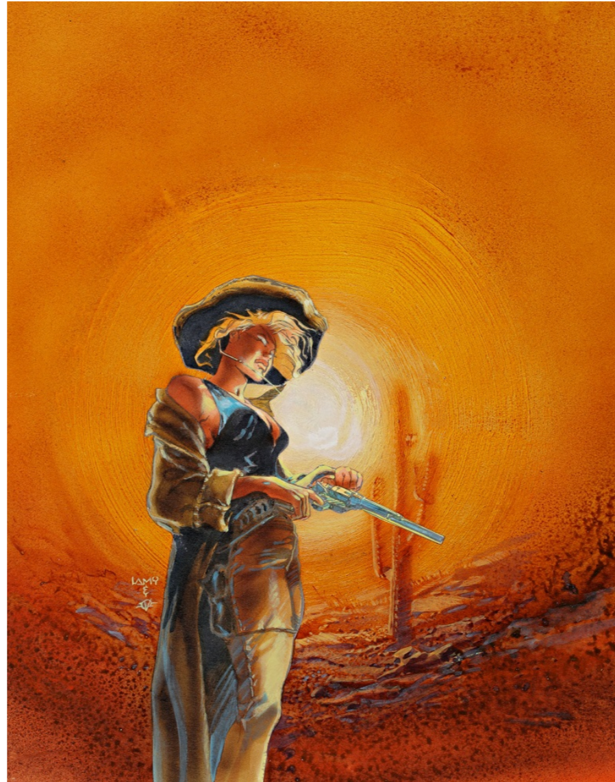
Couverture d'Adios Palomita par Fabrice Lamy

Il y a eu quelques planches d'Hermann qui me sont passées sous le nez, mais il y en a tellement... En revanche la couverture d'Adios Palomita de Fabrice Lamy et Olivier Vatine, qui est passée aux enchères sur le net, je regrette vraiment :