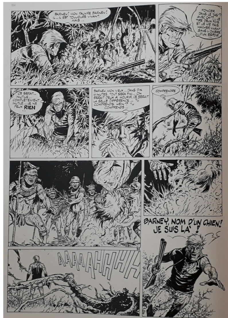
Guérilla pour un fantôme