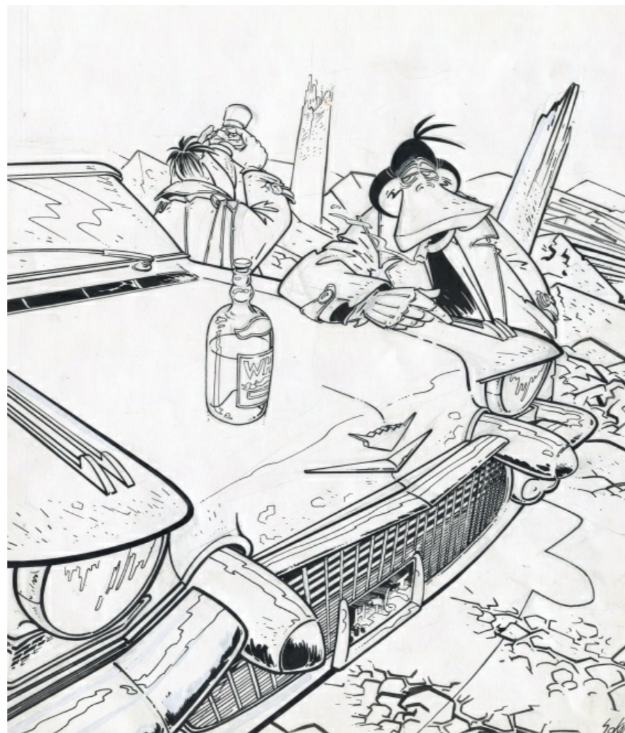
Inspecteur Canardo par Benoît Sokal