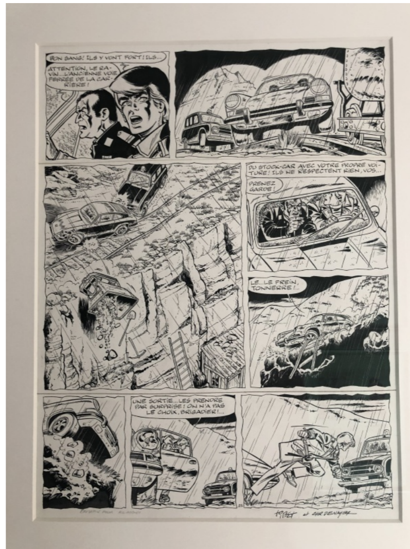
Planche de Ric Hochet par Tibet proposée à la vente par 2dCHRIS

Comme cette très jolie Ric Hochet avec la Porsche dans un rôle de premier plan :