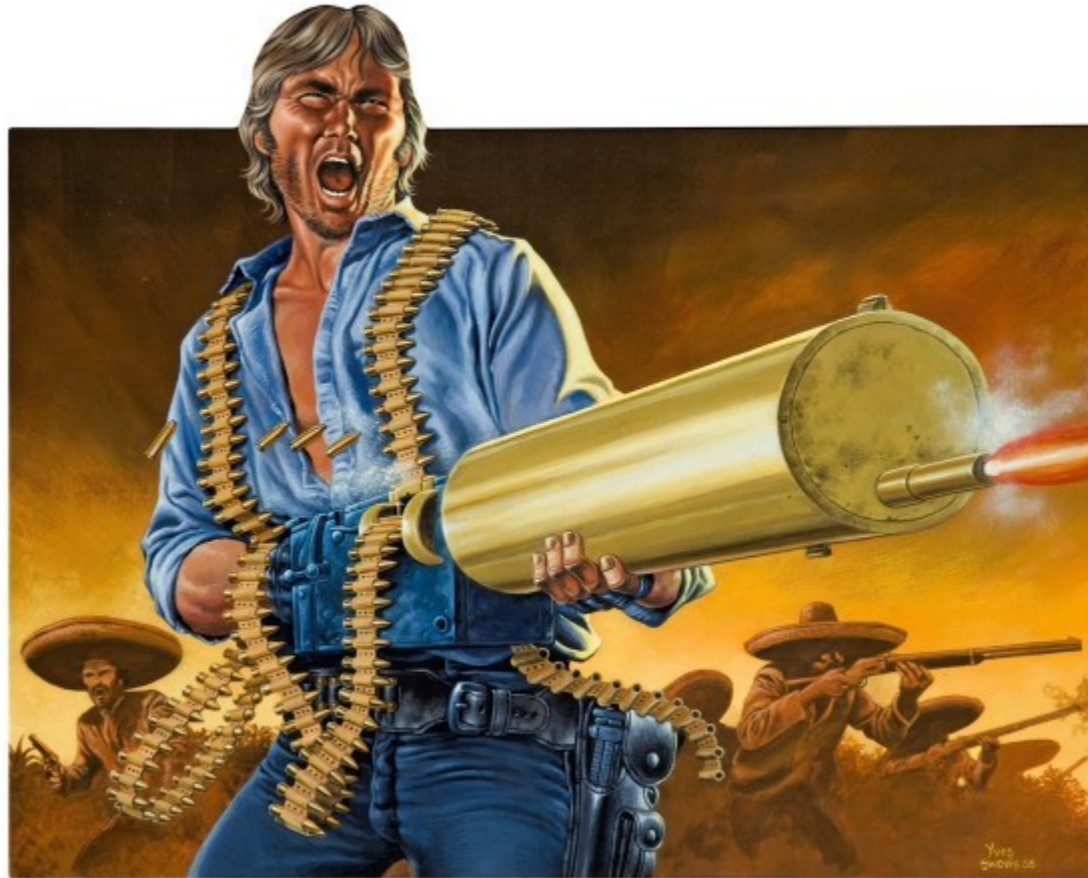
Couverture de Durango "Le destin d'un desperado"