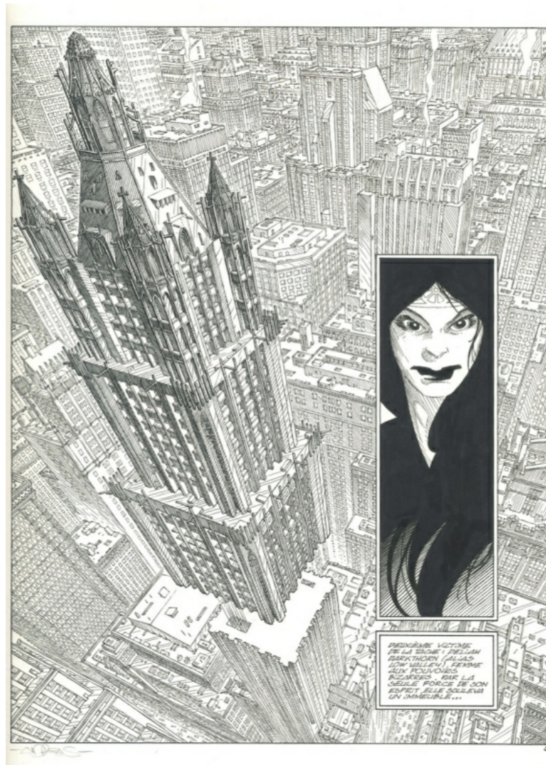
Planche originale de Rork par Andreas proposée à la vente par MrMUM

Ces deux planches ne sont néanmoins pas vraiment une priorité pour moi car je possède déjà de belles oeuvres de ces auteurs.