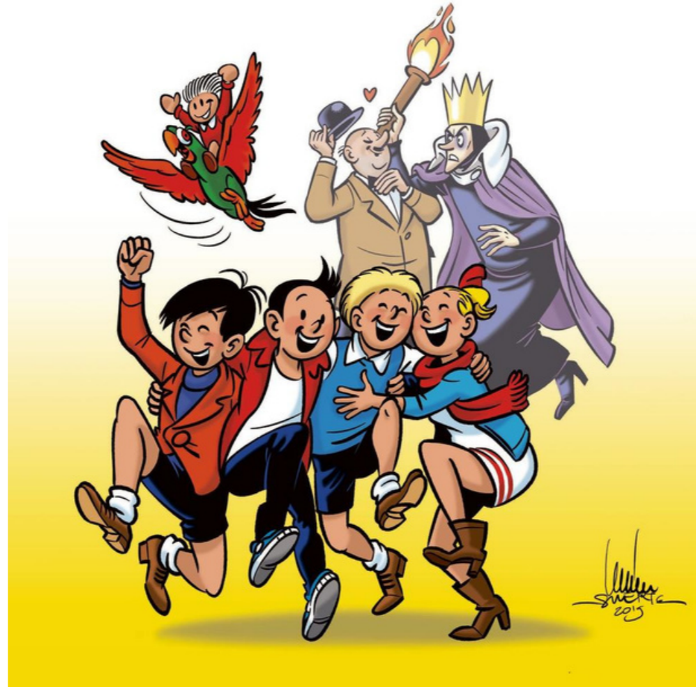
Quelques héros de la bande dessinée flamande

Un changement important s'est produit lorsque mon père est rentré un soir à la maison avec d'autres bandes dessinées qu'il avait reçues de la maison d'édition Archer où il devait se rendre pour son travail.