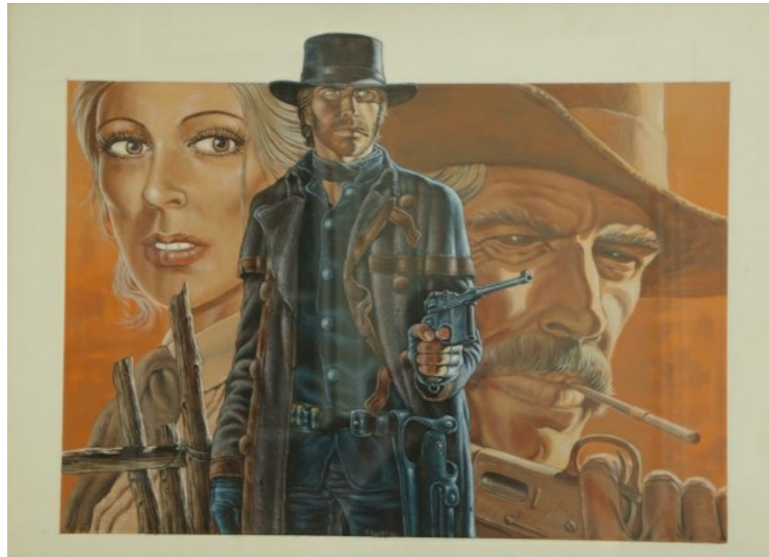
Couverture de Durango par Yves Swolfs, dans la collection de Morti

La première est une couverture de Durango :