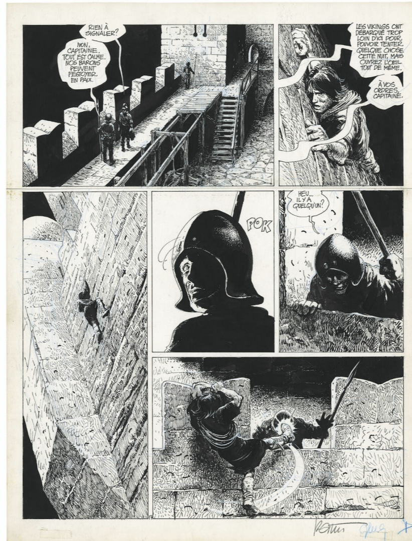
Planche originale de Thorgal "La chute de Brek Zarith" par Grzegorz Rosinski

Pour moi, cela reste l'une des plus belles pages que j'ai jamais vue et qui était encore à ma portée (financière). C'est une page d'un Rosinski à son top qui a tout pour moi : peu de texte, pas tellement de cases donc des dessins plus grands, une scène de nuit, bien détaillée, présence du héros et un peu d'action mais surtout une page incroyablement équilibrée et qui est lisible de près et de loin.