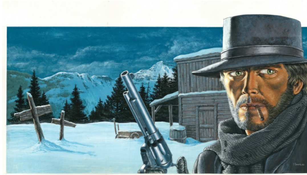
Couverture de Durango par Yves Swolfs

Il y a peut-être une dizaine de pièces auxquelles je suis très attaché et qui ne quitteront probablement jamais ma collection mais il y en a une qui est vraiment ma préférée et c'est cette couverture du premier Durango :